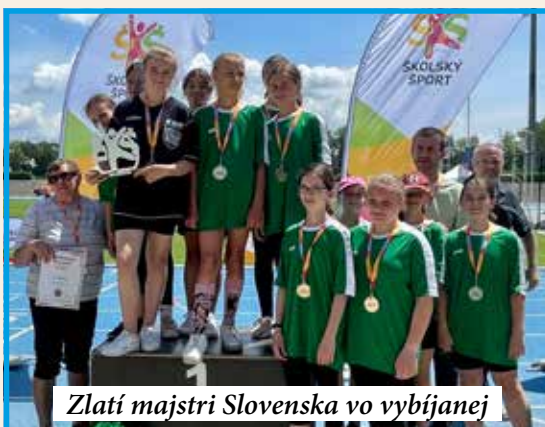
Zlatí majstri Slovenska vo vybíjaní