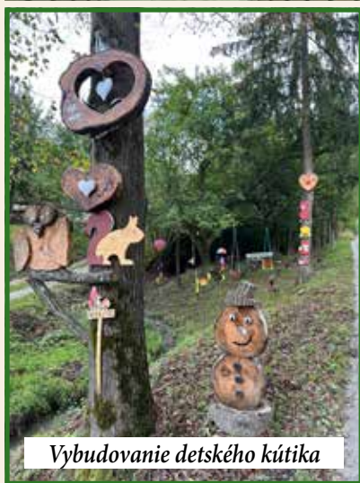
Vybudovanie detského kútika