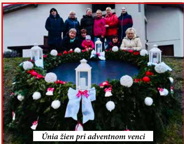
Únia žien pri adventnom venci

Svätý Mikuláš s pomocníkmi opäť rozdával sladké odmeny žiakom základnej a materskej školy.