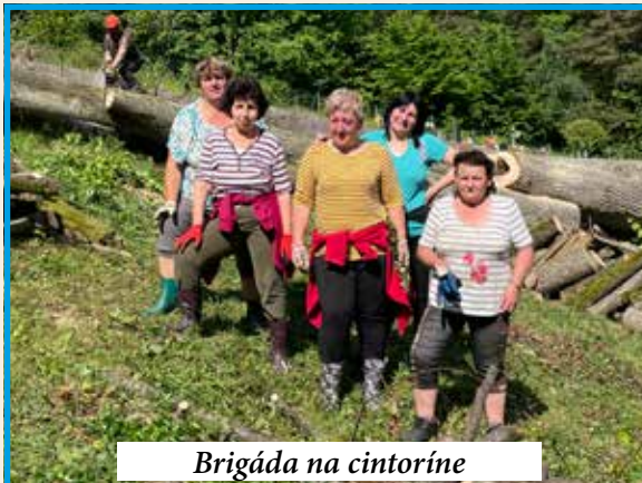
Brigáda na cintoríne