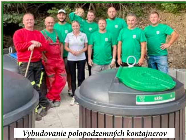
Vybudovanie polopodzemných kontajnerov