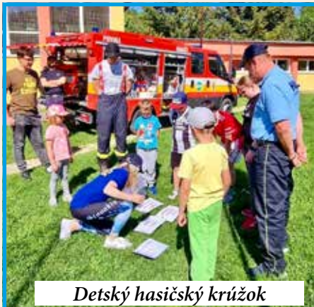
Detský hasičský krúžok