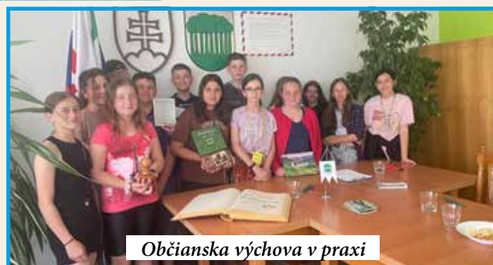
Občianska výchova v praxi