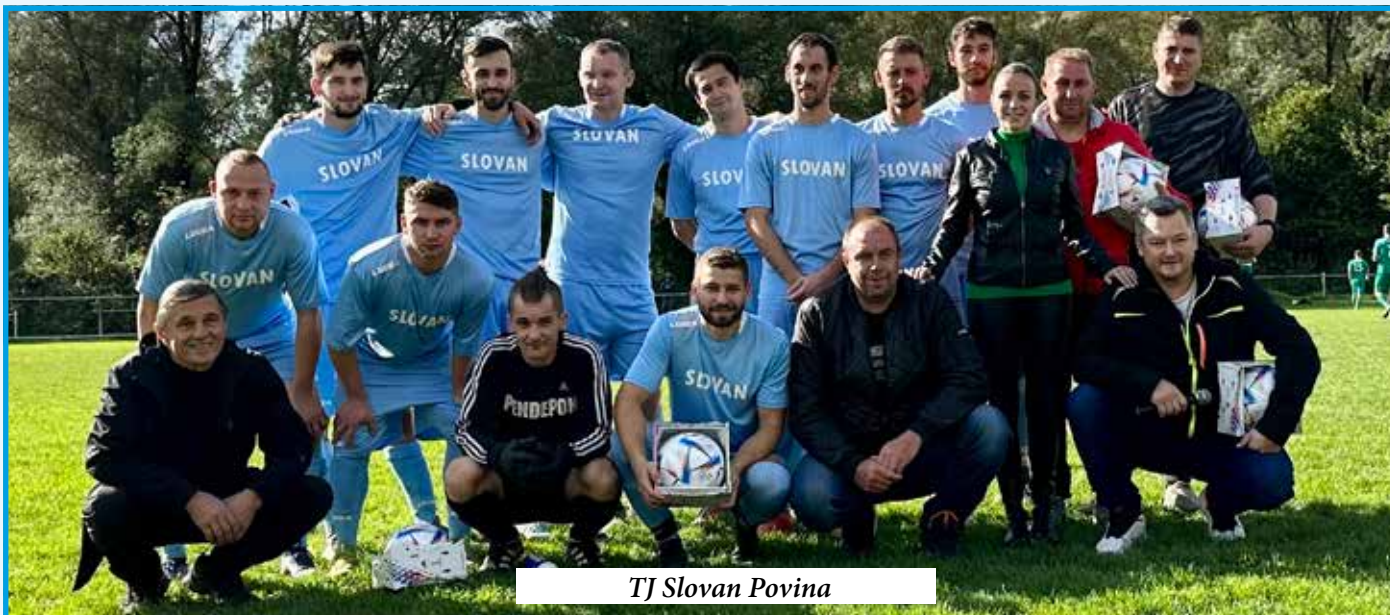
TJ Slovan Povina