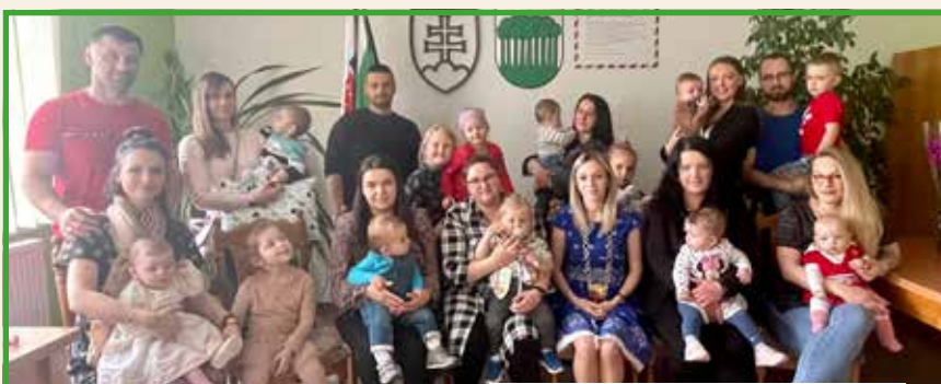
Uvítanie detí do života

Hoci nám počasie nedovolilo byť v teréne, simulácie dusiaceho sa dieťaťa, nešťastného pádu z výšky, záchrana muža, ktorý zapil lieky alkoholom, či muž zasiahnutý elektrickou vodou... Odborným vyšetrením a prvou pomocou nás previedli dobrovoľníci Záchraného systému