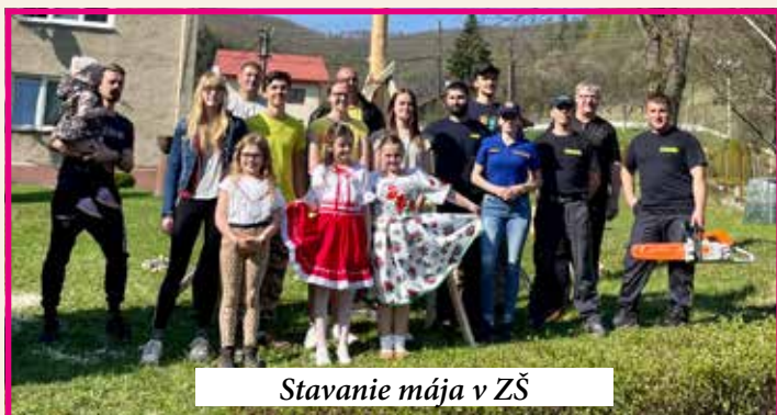
Stavanie mája v ZŠ