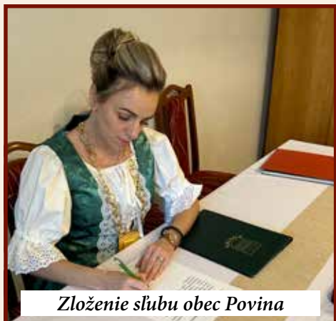
Zloženie sľubu obec Povina

Dovoľte mi, aby som sa poďakovala za prejavenu dôveru v komunálnych aj župných voľbách a zvoleným poslancom OZ ešte raz srdečne gratulujem.