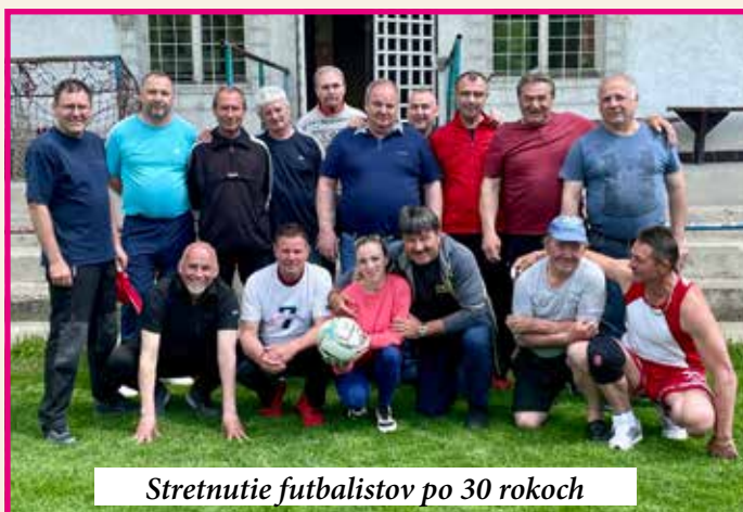
Stretnutie futbalistov po 30 rokoch