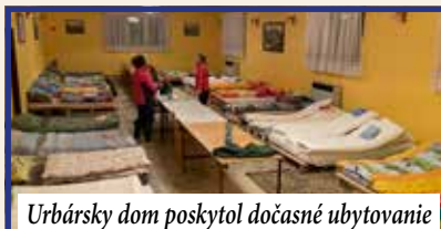
Urbársky dom poskytol dočasné ubytovanie

Marec – mesiac kníh. Návšteva obecnej knižnice a obecného úradu. V marci sa nezabúda ani na medzinárodný deň učiteľov. Každoročne si tento sviatok pripomenieme poďakovaním učiteľom za ich prácu, oddanosť a častokrát aj výchovu našich detí. Ďakujeme.