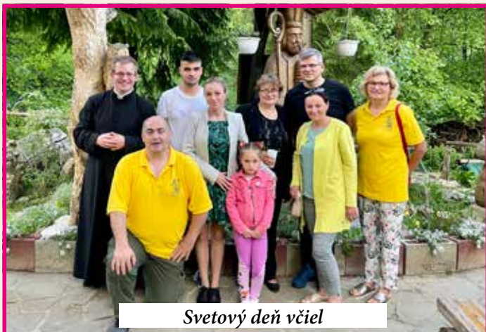
Svetový deň včiel