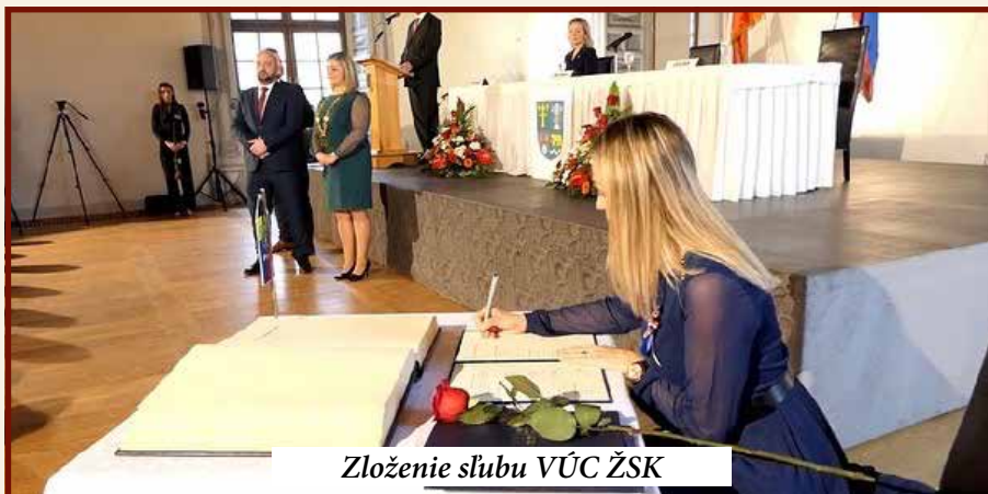
Zloženie sľubu VÚC ŽSK