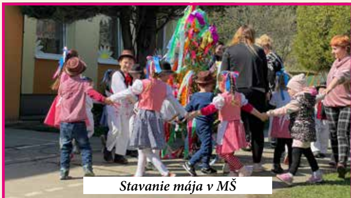
Stavanie mája v MŠ

Stavanie májov má v našej obci dlhodobú tradíciu. Každoročne s poslancami, dobrovoľnými hasičmi, ale aj otcami sa dvíhajú máje v základnej i materskej škole. Ďakujeme nielen im, ale aj pani učiteľkám a žiakom, ktorí nás vždy prekvapia milým kultúrnym programom. K májovému sviatku želáme všetkým hasičom a hasičkám veľa zdravia, fyzickej a psychickej sily. Ďakujeme za obetavosť a odvahu pri každom vykonanom zásahu, za poslanie, ktoré vykonávate pre všetkých ľudí. Na Deň matiek sa Urbársky dom zaplní nielen mamičkami, ale aj babičkami či krstnými mamičkami. Vystúpenie svojich ratoleští si nenechajú ujsť ani ockovia. Skvelá nálada, veselá vrava, občerstvenie i malý darček sprevádzal aj tohtoročný sviatok všetkých mamičiek. Spomienky a priateľstvá zostávajú aj medzi zaslužilými futbalistami obce Povina. Stretnutie po 30 rokoch bolo fantastické, spomínali na príbehy a zážitky z čias aktívneho a veľmi úspešného futbalu. Zapálením sviečok a modlitbou sme si uctili spomienku na futbalistov, ktorí už nie sú medzi nami. Dobrovoľní hasiči sa venujú aj deťom. Svetový deň včiel sme oslávili svätou omšou v našej včelnici v Povine. Ďakujeme za spojenie síl pri dobrovoľnej brigáde na cintoríne.