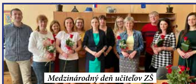
Medzinárodný deň učiteľov ZŠ