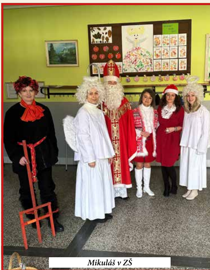
Mikuláš v ZŠ

Poďakovanie patrí sponzorom za futbalové lopty pre ZŠ a TJ Slovan Povina, autoumyvárke za umývanie hasičského auta, všetkým sponzorom pri rôznych obecných akciách, i všetkým ľuďom, ktorí prikladajú