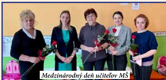
Medzinárodný deň učiteľov MŠ