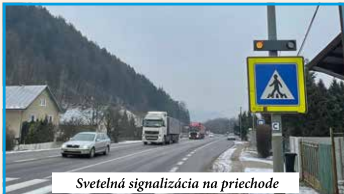
Svetelná signalizácia na priechode