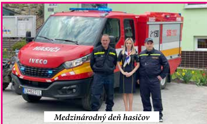
Medzinárodný deň hasičov