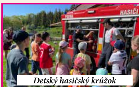
Detský hasičský krúžok