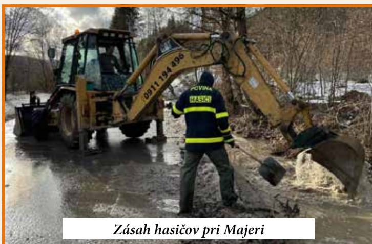
Zásah hasičov pri Majeri