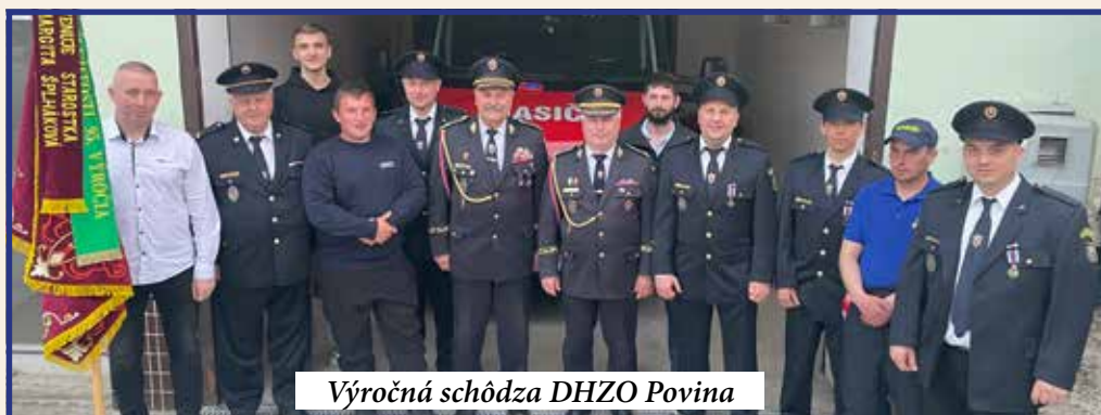
Výročná schôdza DHZO Povina