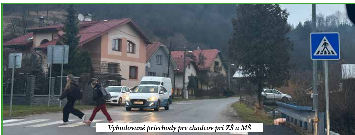
Vybudované priechody pre chodcov pri ZŠ a MŠ

2022-23 pre Povinu neľútostné, nakoľko ďalší zápas sme hrali opäť na súperovom ihrisku v Lodne. Tento zápas sme opäť zvládli a zvíťazili sme. Jesenná časť našim hráčom priniesla viac víťazstiev na súperových ihriskách ako doma. Napriek niektorým nevydareným zápasom prezimujeme na druhom mieste len o skóre za Rudinskou. Snahou TJ v medzisúťažnom období bolo zastabilizovať a doplniť hráčsky káder, čo sa nám aj čiastočne podarilo. Na nadstavujúcu jarnú časť sa počas tejto zimy musíme dôsledne pripraviť, aby sme boli schopní odolávať súperom a podávali čo najlepšie výkony. Svojím herným prejavom a zodpovednou hrou chceme potešiť našich fanúšikov. Poďakovanie hráčskeho kádra a realizačného tímu TJ Slovan Povina patrí našim skvelým fanúšikom.